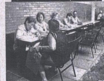
SAÚDE > orientações sobre câncer