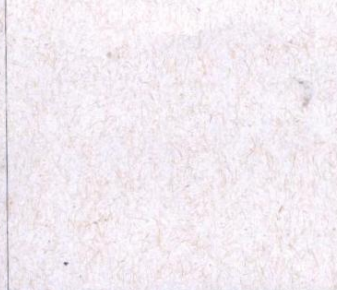
MAQUIAGEM > pintura de rosto e mãos