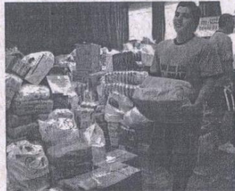
DOAÇÕES > voluntários levam os alimentos para caminhões