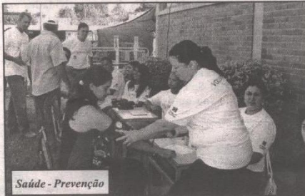
Saúde - Prevenção