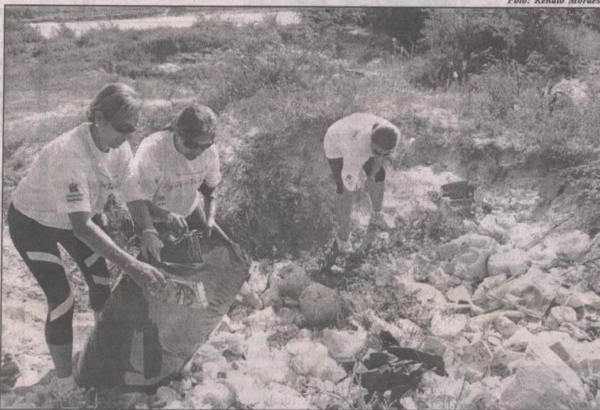
Diversas entidades e segmentos deram sua parcela de contribuição no Dia da Ação Voluntária

A Fundação Bradesco está de Parabéns, assim como todos os voluntários articuladores e participantes que fizeram acontecer com sucesso o grandioso "DIA NACIONAL DE AÇÃO VOLUNTÁRIA" no domingo, dia 9 de março de 2008. Este ato de solidariedade também demonstra o quanto é importante à união para melhorar a qualidade de vida da comunidade. No total foram contabilizados 24.295 atendimentos e 757 voluntários na área da saúde, cidadania, lazer, esporte, cultura, assistência social, educação e meio ambiente, atuando em 6 pontos distintos: Escola Estadual de Ensino Fundamental Padre José de Anchieta, Escola Municipal Coronel Sabino de Araújo, Escola Municipal Barão do Rio Branco, Escola Municipal Oliveira Thaddeo, além da Caminhada Ecológica e Limpeza da Mata Ciliar do Rio Ibicuí. Maiores detalhes na página 9.