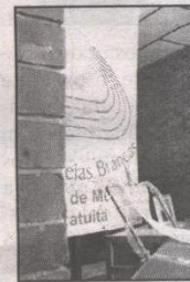
Coral Areias Brancas

Nequi, estiveram presentes visitando todos os setores da escola, que em cada sala disponibilizava um serviço à comunidade, indo desde o atendimento médico até atividades como cinema e teatro. A abertura oficial do evento contou com a presença de diversas autoridades, entre elas o Coronel Lamin, Comandante do 4º RCC, o qual teve importante participação com seus comandados, especialmente os que atuam na área de saúde e prestaram atendimento médico e odontológico. A programação seguiu durante todo o dia com apresentações artísticas entre outras atrações, e o encerramento aconteceu às 17 horas. Nas fotos algumas das atividades desenvolvidas.